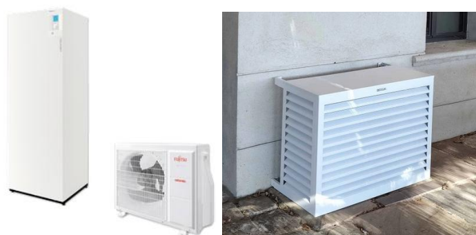
Pompe à chaleur air/eau unité extérieure et intérieure et cache esthétique unité extérieure

Il sera prévu pour chaque unité extérieure un cache esthétique sur toutes les faces hormis la face du dessous et au niveau de la face arrière (aspiration)) de marque Décoclim ou équivalent en aluminium (RAL 9010 à confirmer avec l'architecte). Il sera de taille S (dimensions extérieures : H69, L94 , P46-61cm).