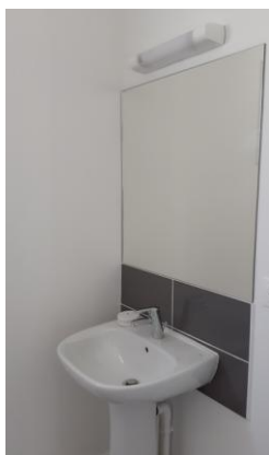
Lavabo sur colonne avec miroir