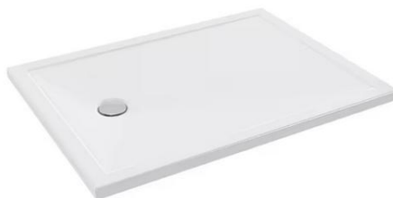
Receveur de douche