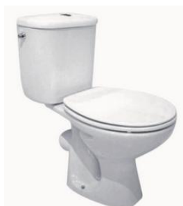
WC au sol