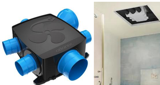
Caisson d'extraction individuel

Le rejet d'air vicié du ventilateur sera éloigné à plus de 8 m de toute prise d'air neuf ou d'ouvrants.