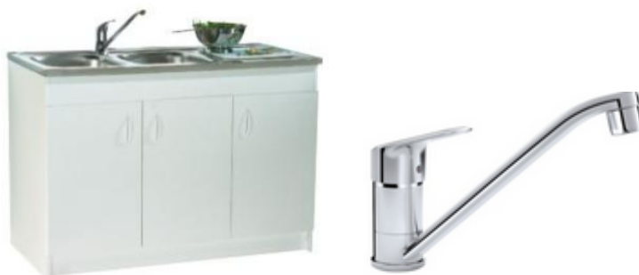
Meuble évier et robinetterie à bec fendu