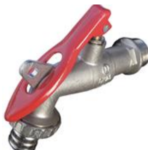
Robinet de puisage à tête verrouillable